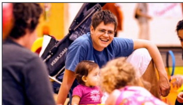
Un papa accompagné de sa petite fille participant à une activité parent-enfant lors de LA SU-PÈRE FÊTE 2013 à Montréal.

Un sondage a été réalisé auprès des partenaires ayant inscrit une ou des activités dans le cadre de la Semaine Québécoise de la Paternité. Les questions avaient comme objectif de vérifier si l'activité avait bien eu lieu, le nombre de personnes rejointes, la visibilité dans les médias locaux et le désir de présenter ou non une activité lors de la prochaine édition de l'événement en 2014.