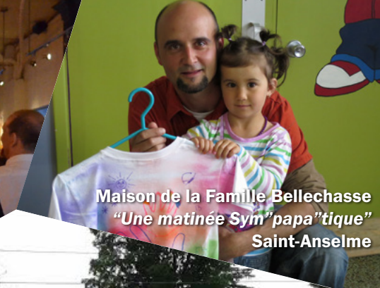
Maison de la Famille Bellechasse "Une matinée Sym"papa"tique" Saint-Anselme