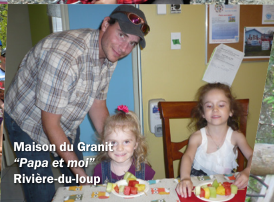
Maison du Granit "Papa et moi" Rivière-du-loup