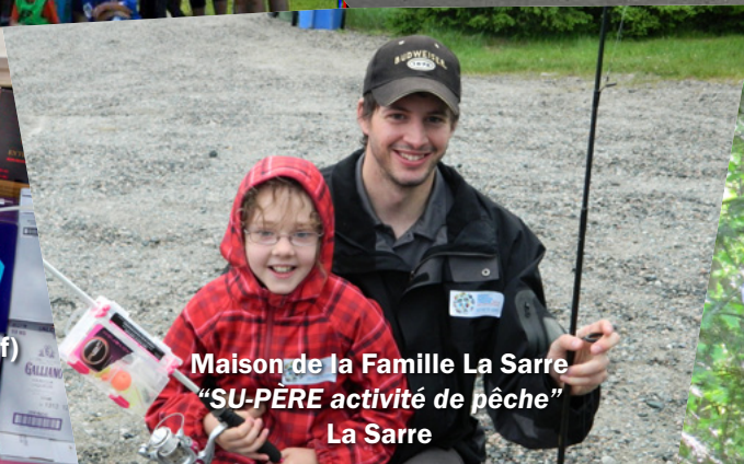
Maison de la Famille La Sarre "SU-PÈRE activité de pêche" La Sarre