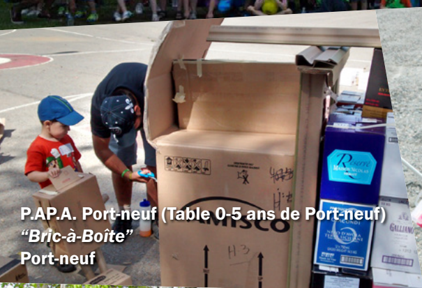
P.A.P.A. Port-neuf (Table 0-5 ans de Port-neuf) "Bric-à-Boîte" Port-neuf