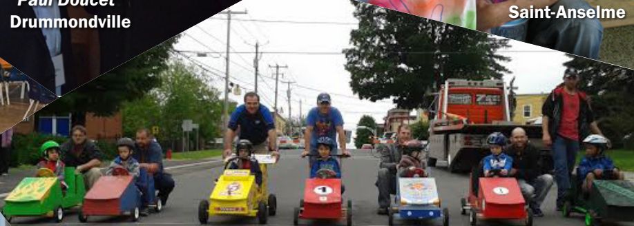
CAL de Waterloo et région "Course de boîtes à savon" Waterloo