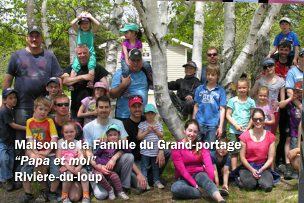
Maison de la Famille du Grand-portage "Papa et moi" Rivière-du-loup