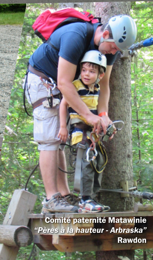
Comité paternité Matawinie "Pères à la hauteur - Arbraska" Rawdon