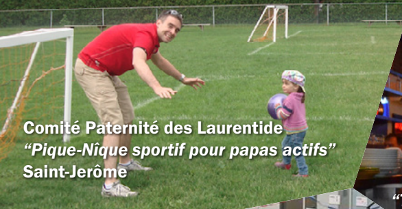
Comité Paternité des Laurentide "Pique-Nique sportif pour papas actifs" Saint-Jérôme